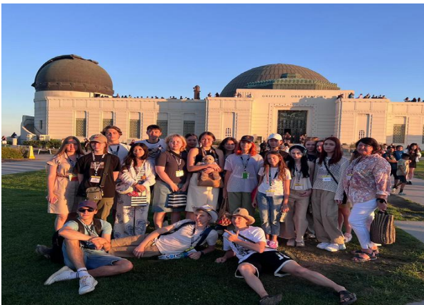
Parcul Griffith si Observatorul