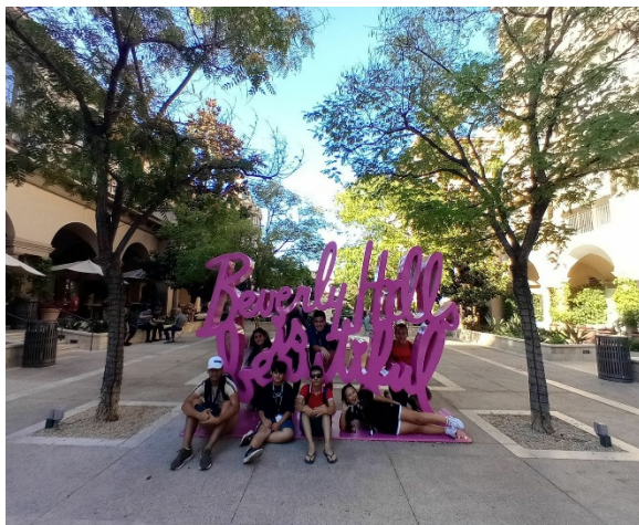
Beverly Hills si Rodeo Drive